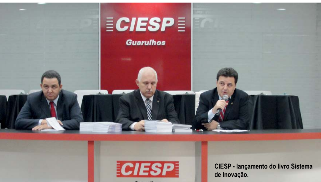
CIESP - lançamento do livro Sistema de Inovação.

O Parque Tecnológico é o grande projeto que marca a transição da Guarulhos industrial para a Guarulhos do conhecimento. Podemos transformar esta cidade, viajamos e conhecemos outros projetos e sabemos que o Parque Tecnológico é transformador. O projeto está pronto para ser desenvolvido, temos todo o suporte técnico da AGENDE.