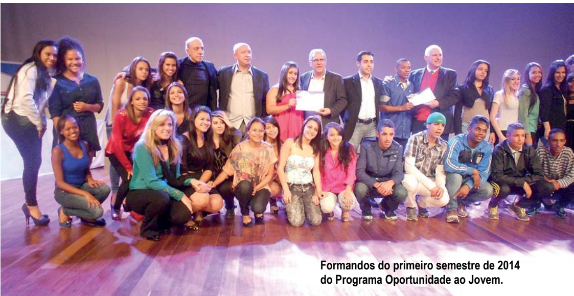
Formandos do primeiro semestre de 2014 do Programa Oportunidade ao Jovem.

AGENDE: Você sempre acredita na pessoas e na formação, somente sobre os programas de capacitação da AGENDE.