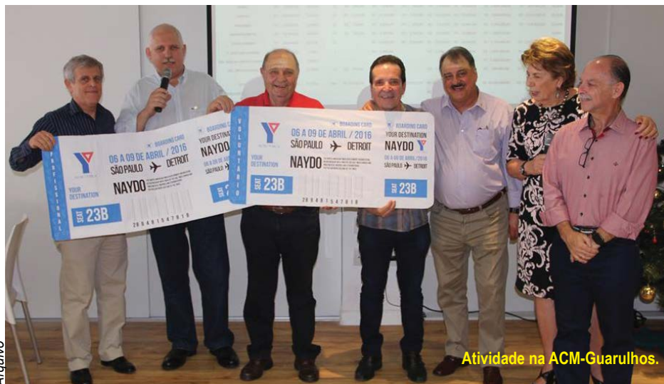
Atividade na ACM-Guarulhos.

Portanto, aos agentes públicos e privados cabe o desafio de incentivar a economia local, dando um voto de confiança para a sociedade civil organizada da cidade e trazendo os movimentos financeiros para as cooperativas e construindo juntos melhores condições locais.