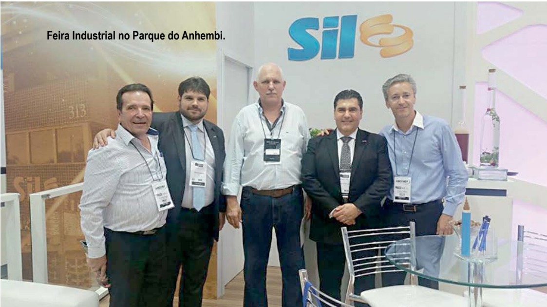
Feira Industrial no Parque do Anhembi.

dades de promoção que estão no Marketing. Precisamos virar este jogo. Estivemos com o pessoal da Bionóvis há dois anos e com cientistas de Portugal com interesse em investir no Parque Tecnológico. O recado foi bem claro: ofereça a área com todos os licenciamentos que investiremos lá.