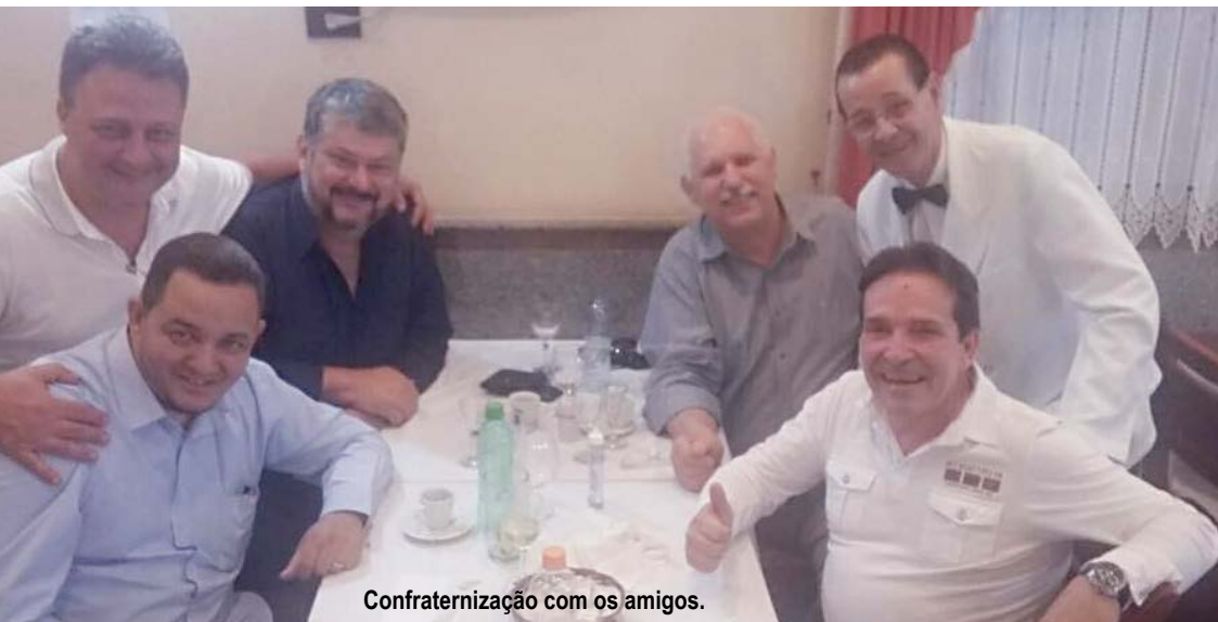
Confraternização com os amigos.

que o Poder Público precisa oferecer. Temos também o programa de qualificação no CDC Uirapuru que é outro projeto digno de elogios e com grande retorno social.