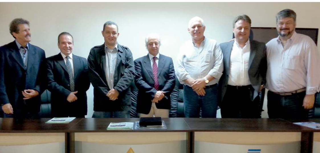
Mesa de Honra da solenidade de assinatura do convênio com Biocant/Portugal.

Fizemos um estudo na AGENDE que demonstra que as atividades desenvolvidas aqui são as operacionais para a produção e as ativi-